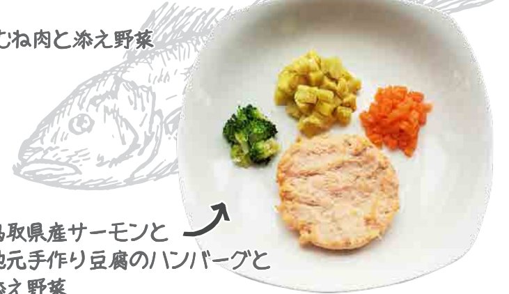
鳥取県産サーモンと 地元手作り豆腐のハンバーグと 添え野菜