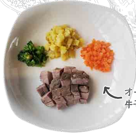
オーストラリア産 牛モモ肉と添え野菜